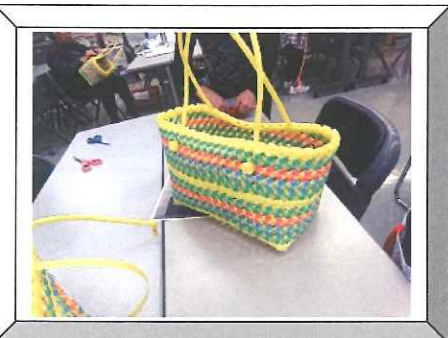
PPバンドかご編み教室