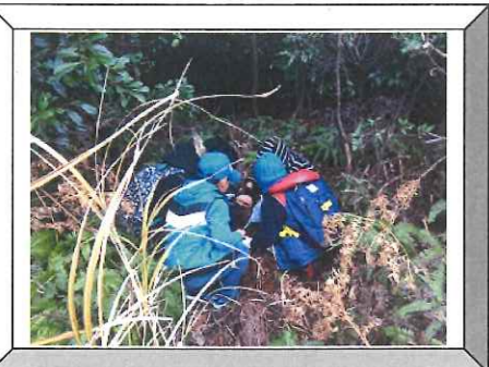
自然体験プログラム