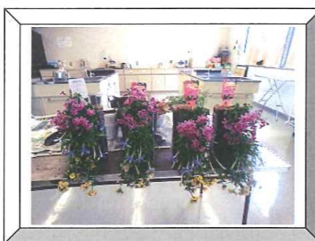
季節の寄せ植え教室