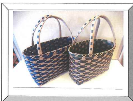
クラフトバンドかご編み教室