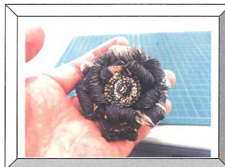
新聞コサージュ作り