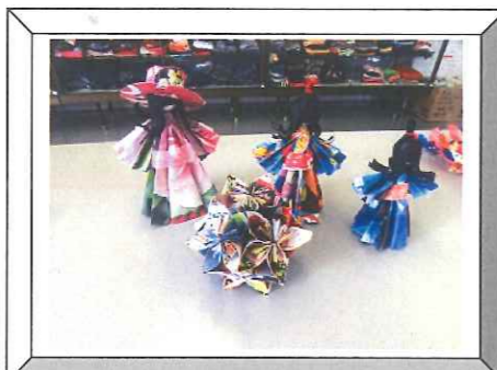
チラシで折紙教室